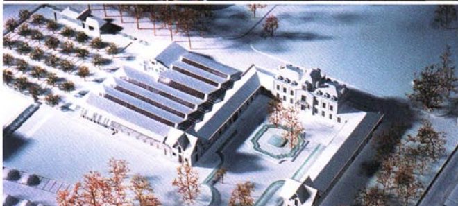
Maquette du projet.

Maîtrise d'œuvre Brochet/Lajus/Pueyo Maîtrise d'ouvrage Ville de Pessac Voir fiche technique 113