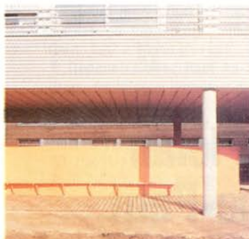
...qui multiplie les parcours et les espaces protégés.

Divisant le programme, les architectes ont réparti les chambres dans deux bâtiments en longueur, deux petites barres pas tout à fait parallèles, distantes d'un peu plus d'une dizaine de mètres, juchées sur pilotis, dans la ligne de pente du talus. Deux édifices à l'échelle humaine qui, de part et d'autre d'un jardin en pente, établissent un dialogue qui n'est pas que formel : des vues sont ménagées qui permettent de s'apercevoir, de se saluer, d'une course à l'autre, ou de chambre à coursive. Un dialogue qui s'établit aussi par le traitement particulier de chaque façade. A la façade ouest sur jardin, en bardage de bois red cedar répond en face la façade est en béton peint perforé de petites ouvertures rappelant la chapelle de Ronchamp. Côté parc, c'est une paroi en tôle d'aluminium