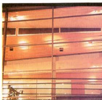
De nuit, derrière le mur-rideau, le passage en légère pente qui relie les chambres.

trée, vaste, est offerte aux patients, comme aux familles en visite. Posés librement dans l'espace, côté nord, des blocs fermés cachent les services et restaurants du personnel soignant.