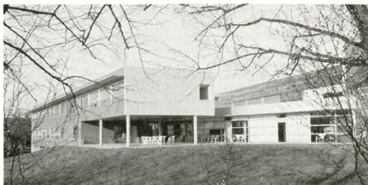
Au cœur d'un parc, une résidence composée de plusieurs bâtiments...