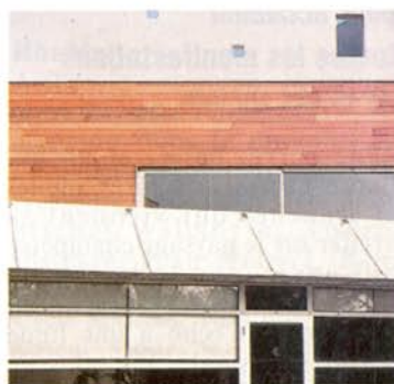
La diversité des matériaux de façade: du béton, du bois et de l'aluminium.